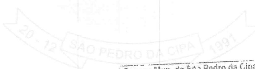
EDUARDO JOSÉ DA SILVA ABREU PREFEITO MUNICIPAL

São Pedro da Cipa-MT, 05 de Julho de 2023.