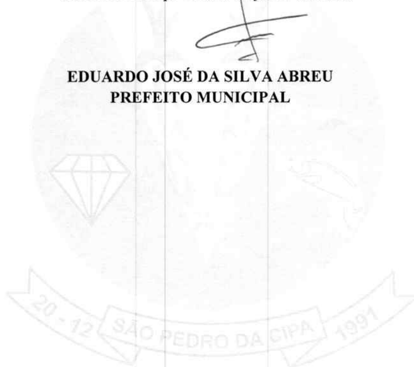
EDUARDO JOSÉ DA SILVA ABREU PREFEITO MUNICIPAL

São Pedro da Cipa-MT, 23 de junho de 2022.