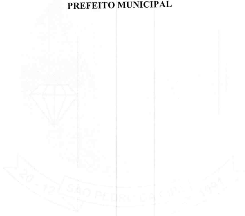
EDUARDO JOSÉ DA SILVA ABREU PREFEITO MUNICIPAL

Gabinete do Prefeito, Edifício Sede do Poder Executivo, em São Pedro da Cipa – MT, aos 25 dias do mês de Janeiro de 2023.