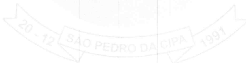
EDUARDO JOSÉ DA SILVA ABREU PREFEITO MUNICIPAL

Gabinete do Prefeito, Edifício Sede do Poder Executivo, em São Pedro da Cipa-MT, aos 09 dias do mês de agosto de 2023.